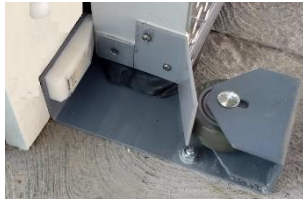
BASE CON RUEDA DE EMPUJE PREUBICADA CON ANGULO DE CIERRE Y PROTECTOR DE EMPAQUE