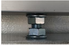
COLGADOR EN RANURA DE TROLLEY CON TUERCAS DE FIJACIÓN Y AJUSTE