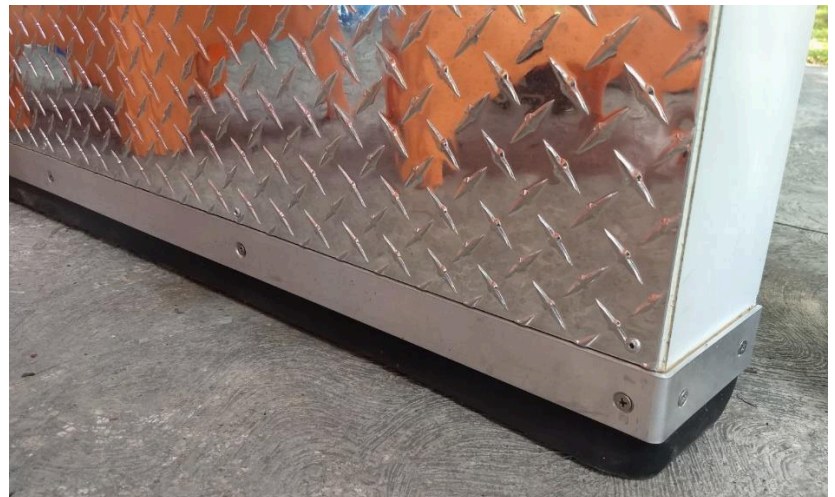
SISTEMA PERIMETRAL DE EMPAQUE DOBLE DE PVC FLEXIBLE Y SOLERA DE PROTECCIÓN DE ALUMINIO