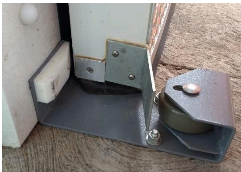
BASE CON RUEDA DE EMPUJE PREUBICADA CON ANGULO DE CIERRE Y PROTECTOR DE EMPAQUE