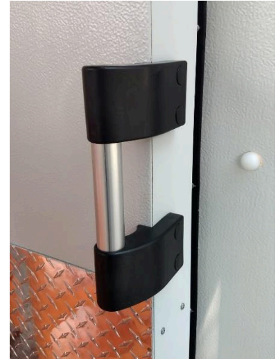
MANIJA DE ALUMINIO TUBULAR Y APOYOS DE PLÁSTICO RIGIDO