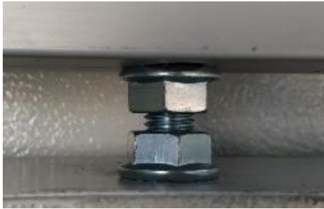
COLGADOR EN RANURA DE TROLLEY CON TUERCAS DE FIJACIÓN Y AJUSTE