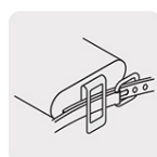
Clip para cinturón