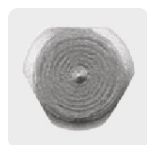
Zanco P3 antiderrapantes