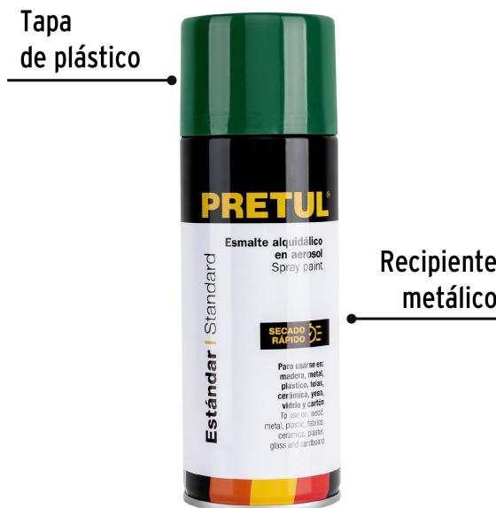
Tapa de plástico

Color aproximado. El tono puede variar de acuerdo a la superficie de aplicación