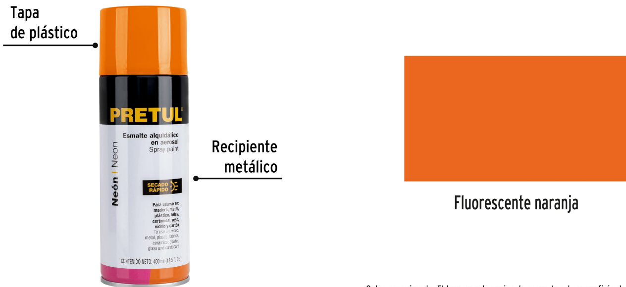
Color aproximado. El tono puede variar de acuerdo a la superficie de aplicación