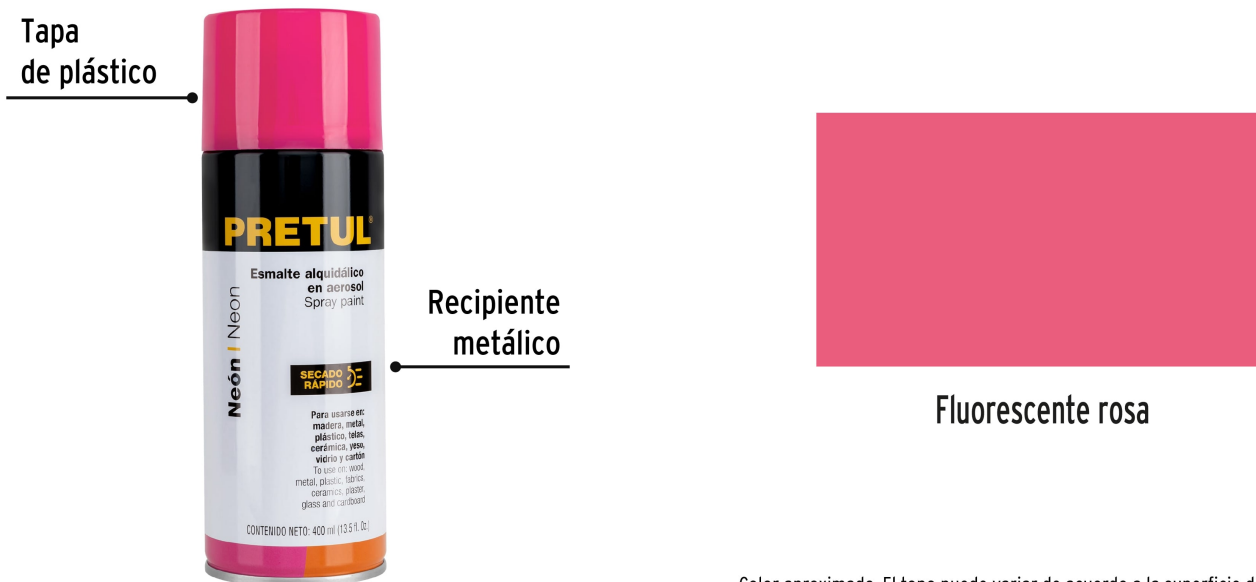
Color aproximado. El tono puede variar de acuerdo a la superficie de aplicación