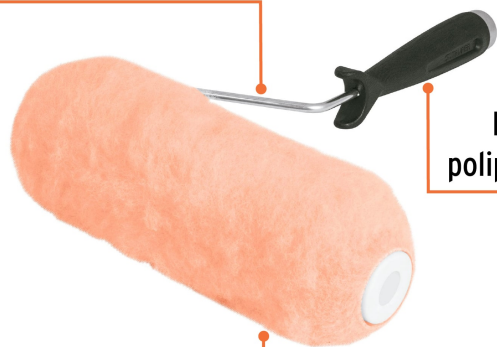
Felpa de poliéster de alta densidad