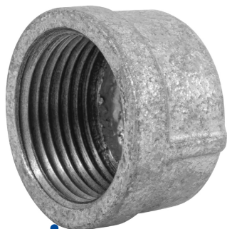
Conexión roscable de 1" NPT